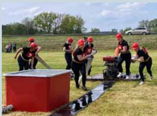
ČINNOST SDH SVĚRADICE V ROCE 2024