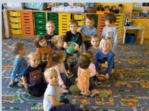
MATEŘSKÁ ŠKOLA: OHLÉDNUTÍ ZA ROKEM 2024