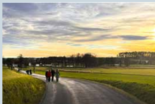
NOVOROČNÍ POCHOD – NOVÁ TRASA