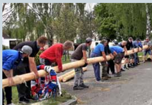
SDH SVĚRADICE – ČINNOST V ROCE 2020