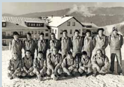
PROCHÁZKY HISTORIÍ FOTBALOVÉHO KLUBU