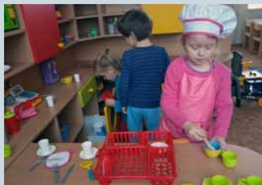
MATEŘSKÁ ŠKOLA – OHLÉDNUTÍ ZA ROKEM 2020