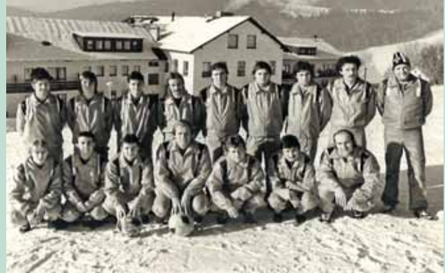
1981 – soustředění A-mužstva v rekreačním středisku ÚV SDR Brčálník

C) Rozvoj mezinárodních vztahů – projednat s orgány OV ČSTV obnovení družby s družebním oddílem z NDR Spartenleitung Eilenburg a při případné návštěvě řádně reprezentovat naši TJ.