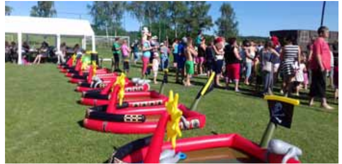
Vzpomínka na dětský den 2018

Na konec školního roku jsme plánovali opět na hřišti uspořádat dětský den, ale s ohledem na přísná hygienická opatření,